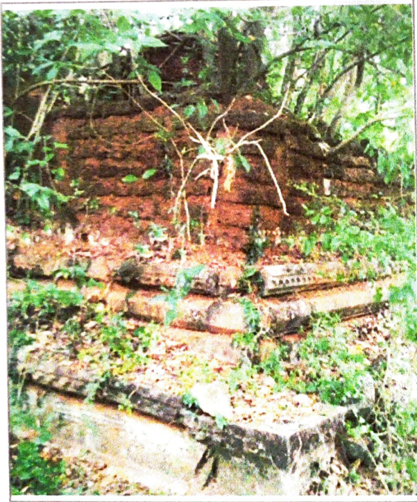
ಅಳಿದುಳಿದ ಗುಪ್ತೆ ಸದಾನಂದ ಮಠ